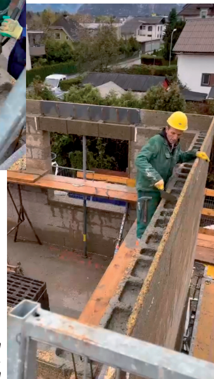
Mauer mit gefüllten Mantelbetonsteinen, Ansicht von oben