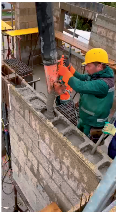
Mantelbetonstein wird mit Beton gefüllt

Hinsichtlich Verarbeitbarkeit ist kein relevanter Unterschied zu bisherigen Betonen gegeben. Wie bei jedem Beton ist auch bei ÖKOBETON eine sorgfältige Nachbehandlung wichtig.